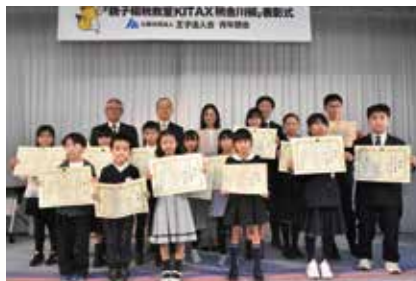
受賞入選の皆さんと