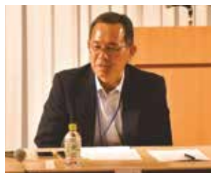
高塚委員長の挨拶