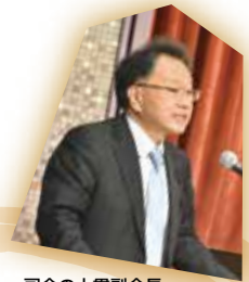
司会の大貫副会長