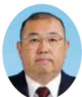
東京国税局長納税表彰