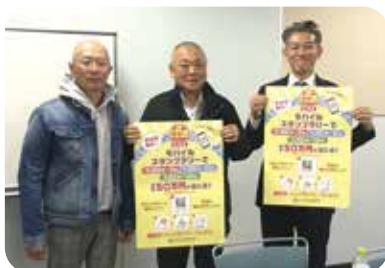
11月25日 第4回 イートラリー 実行委員会