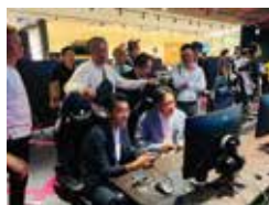
10月28日 (東)青連協第5ブロックスポーツ交流会