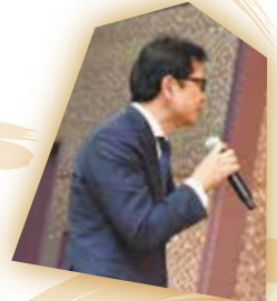
古池委員長よりお礼の言葉