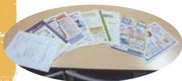
11月5日 源泉部会年末調整説明会