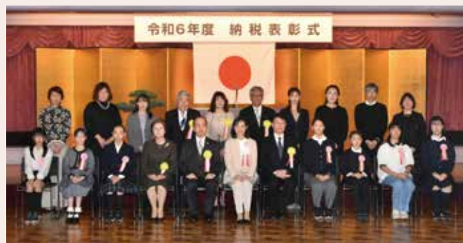
表彰式の会場での集合写真

王子カルチャーロード 令和6年12月5日(木)～12月17日(火) 終了 北とびあ区民プラザ 令和7年 2月6日(木)～2月12日(水) とうこ期待 王子税務署 令和7年 6月頃展示予定 とうこ期待