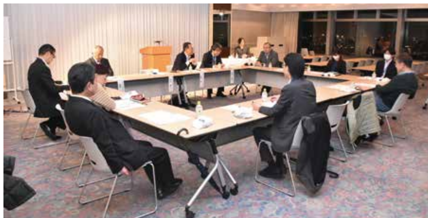
セッションの様子

「税の使い途をきちんと示してほしい」、「大変厳しい中小企業経営を税制度で支援してほしい」、「過去の社会情勢に基いて設計された年収の壁などは見直すべき」などの大変貴重なご意見を頂きましたので、これらを叩き台に提言を取り纏め、「東法連」に税制要望として提出するなど、提言活動を展開させていただきます。次回もより多くの皆様からご意見を頂きたく、法人会会員皆様の「バズセッション」への積極的なご参加をお待ち申し上げております。