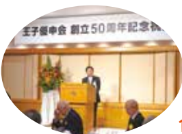
10月25日 王子優申会創立50周年記念祝賀会