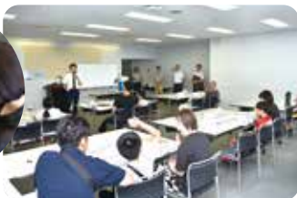
9月8日 親子租税教室 きたつくす未来会議

今回の鑑賞会は明治座にて行われました。女性部会から15名が参加いたしました。お席は花道の横。最前列。今回の公演は梅沢富美男さん、研ナオコさんのお二人が主演と言う事で「笑い」はすでにお約束。このパンフレットを見ただけでも吹き出してしまいます(ズル過ぎ)。